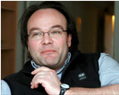
رولاند ميرك رصد أغلب المجازر التي تعرض لها الفلسطينيون على أيدي الصهاينة (الجزيرة)

ثم تصل المسرحية إلى مذبحة مخيم جنين 2002، وتستند فيها إلى شهادة جندي إسرائيلي حول ما تم ارتكابه من جرائم، وصولاً إلى حرب غزة 2009، التي شاهدها الرأي العام الدولي عبر شاشات الفضائيات.